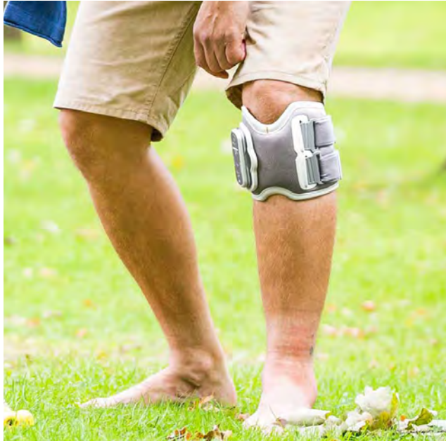
Bioness L300 Go

Når FES anvendes, modtager hjernen mere korrekt information om, hvordan man går, og herved optimeres gangen. Denne type af feedback kan forbedre brugen af de tilbageværende nerveforbindelser mellem hjernen og de muskler, som er påvirket af skaden/sygdommen. Når denne forbedring af centralnervesystemet sker, udvikles der et mere naturligt gangmønster, hvilket er associeret med en øget ganghastighed, færre kompenserende bevægelser og et reduceret energiforbrug.