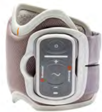
Bioness L300 Go FES-system